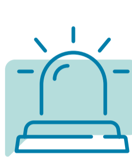
WERK GROEP Acute Zorg