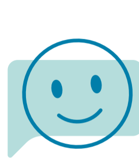
WERK GROEP Gezonde Jeugd