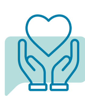
WERK GROEP Gezond Leven en Preventie