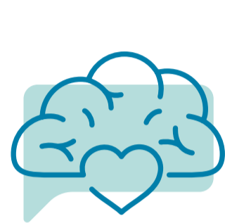
WERK GROEP Mentale Gezondheid